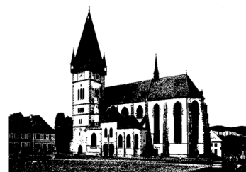
BARDEJOVSKÁ HAŤOVA DVANÁSTKA 1. ročník